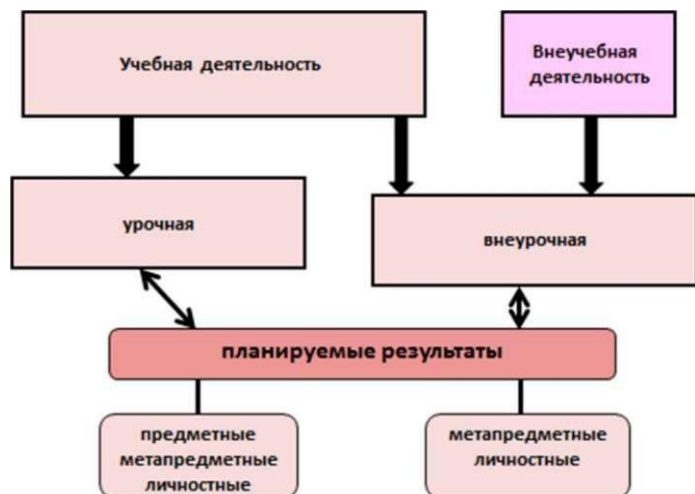
Рис. 1. Схема организации коррекционной работы в МОБУ СОШ д.Идельбаково МР Зианчуринский район РБ

Коррекционная работа в обязательной части (70 %) реализуется в учебной урочной деятельности при освоении содержания образовательной программы. На каждом уроке учитель-предметник ставит и решает коррекционно-развивающие задачи. Содержание учебного материала отбирается и адаптируется с учетом особых образовательных потребностей обучающихся с ограниченными возможностями здоровья. Освоение учебного материала этими школьниками осуществляется с помощью специальных методов и приемов.